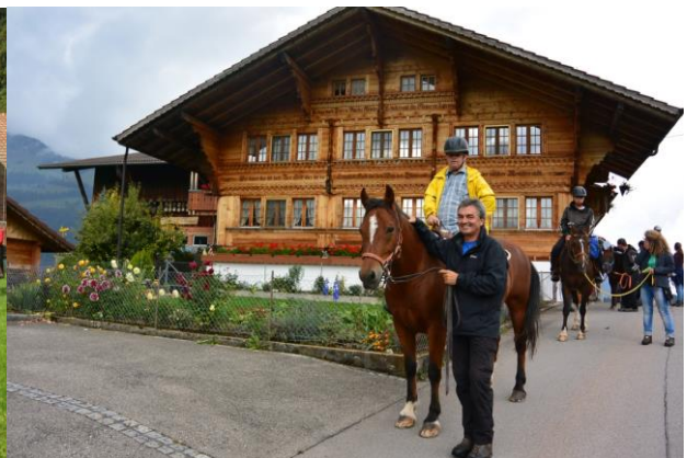
Schöne Häuser hat es im Oberland