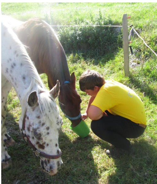
Wenn alle Brunnen trocken sind, muss man erfinderisch werden.