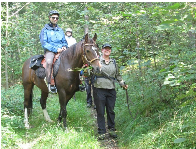
Auf unwegsamem Pfaden