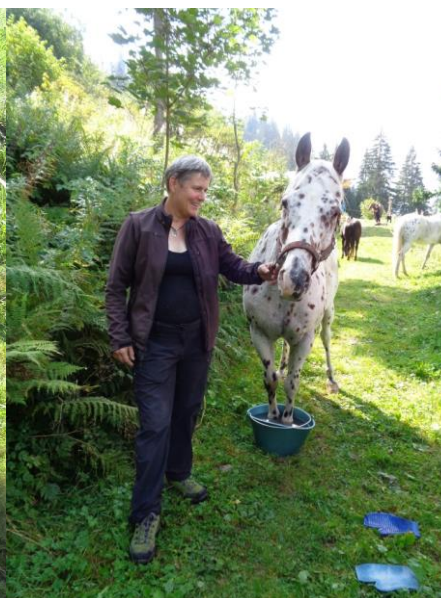
Tut das gut!